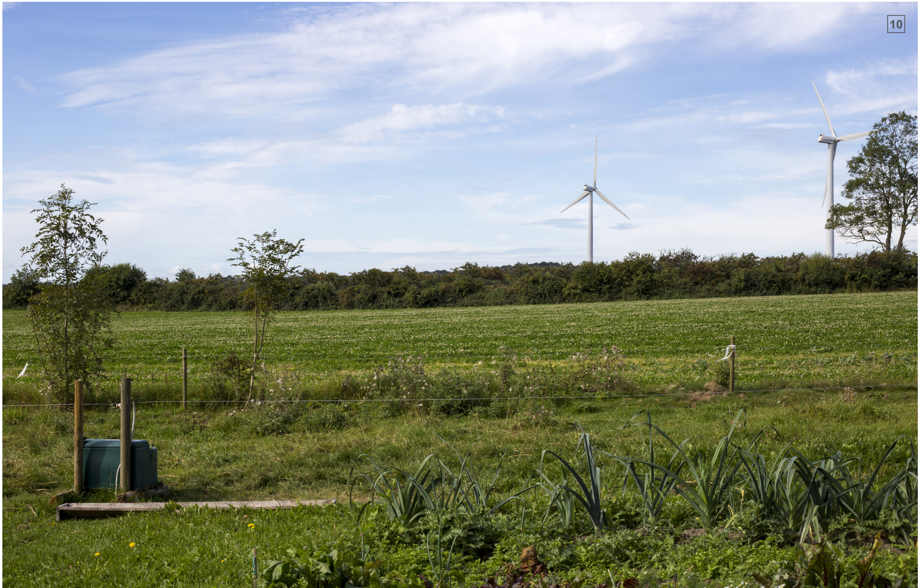
ØRBÆKVEJ 251 | FOTOSTANDPUNKT 10 | VISUALISERING MED LEVENDE HEGN (CA. 4 M)