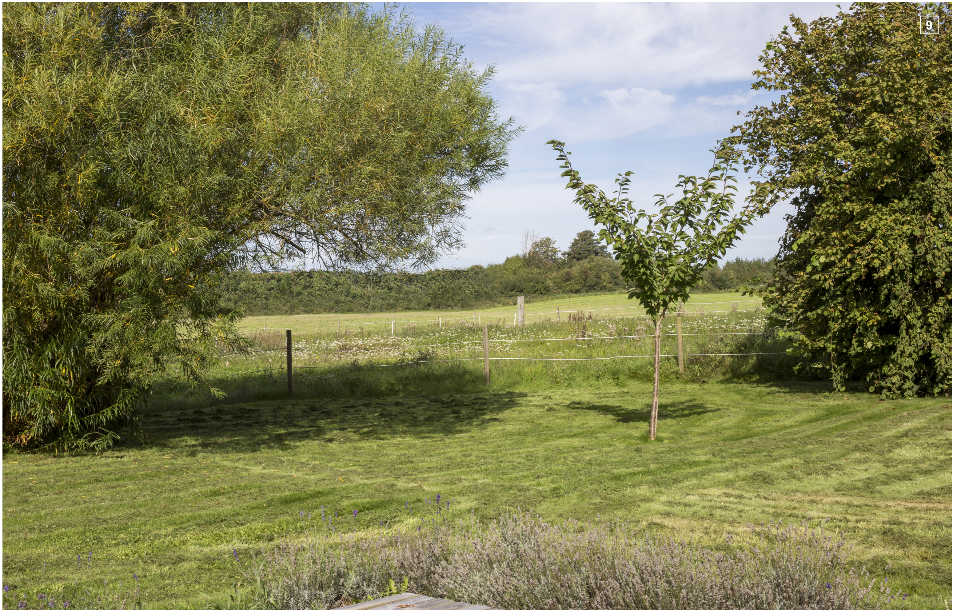
ØRBÆKVEJ 253 | FOTOSTANDPUNKT 9 | VISUALISERING MED LEVENDE HEGN (CA. 5 M)