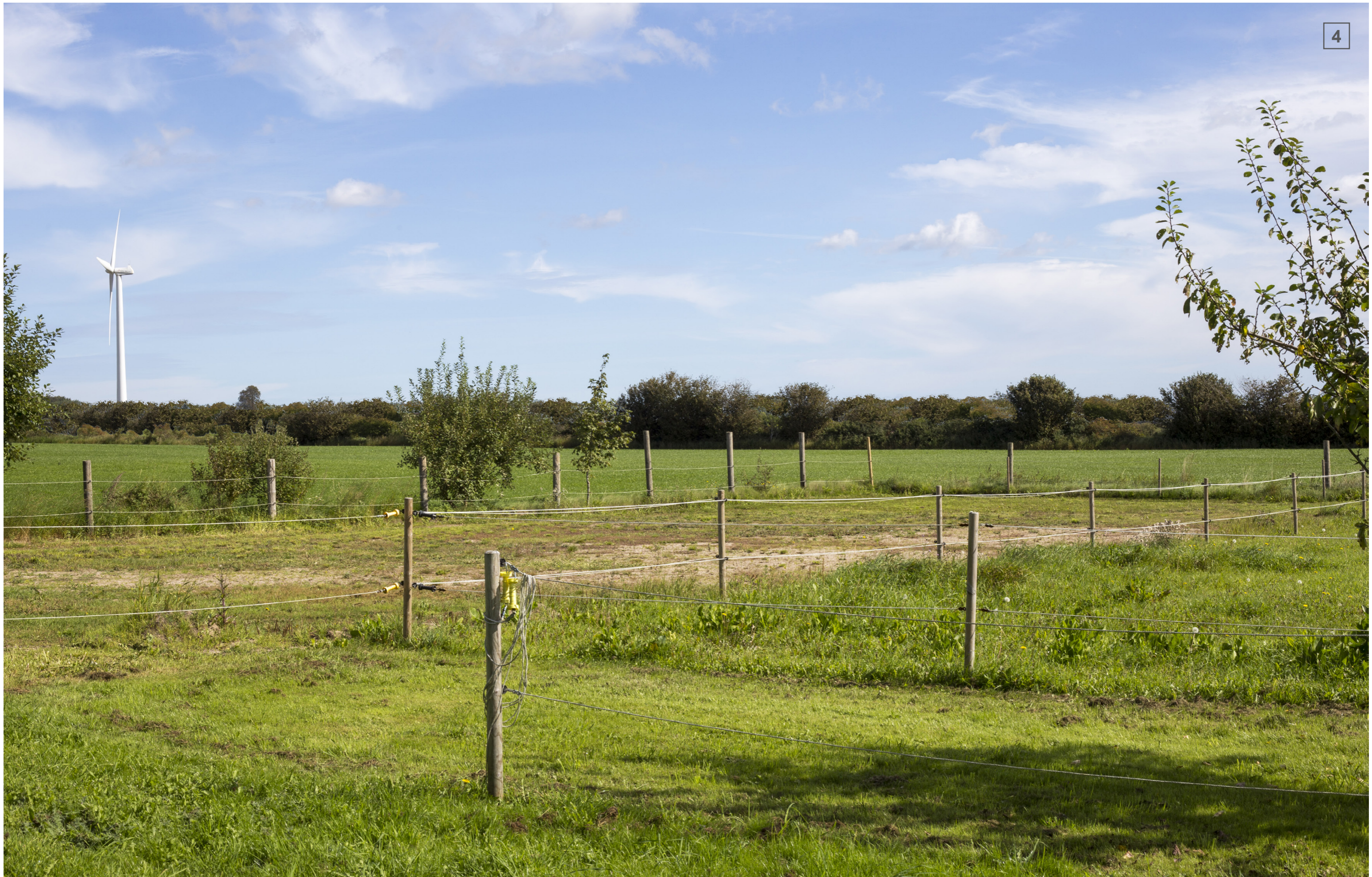
LAKKENDRUPVEJ 47 | FOTOSTANDPUNKT 4 | VISUALISERING MED LEVENDE HEGN (CA. 4 M)