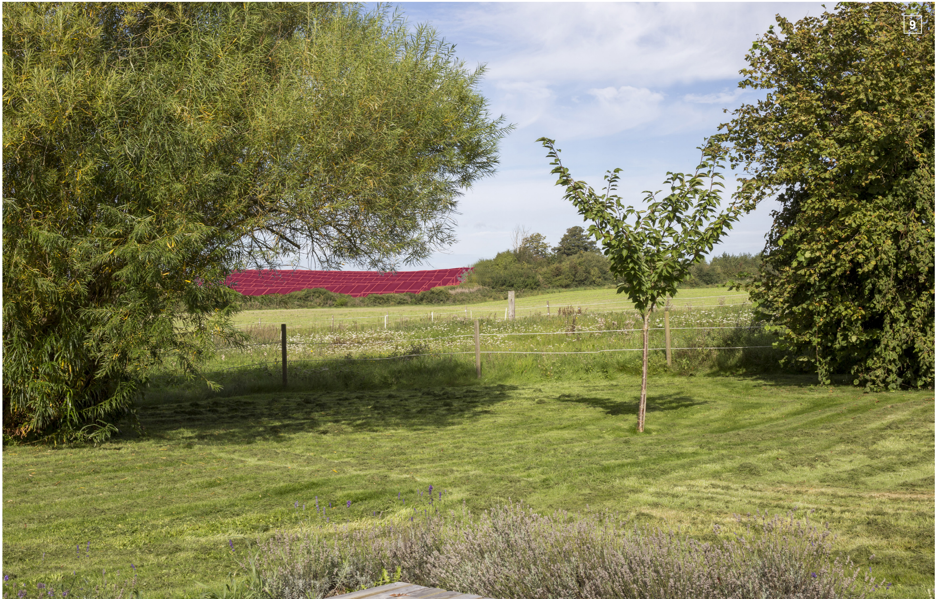
ØRBÆKVEJ 253 | FOTOSTANDPUNKT 9 | VISUALISERING MED FRIHOLDT AREAL MARKERET MED RØD