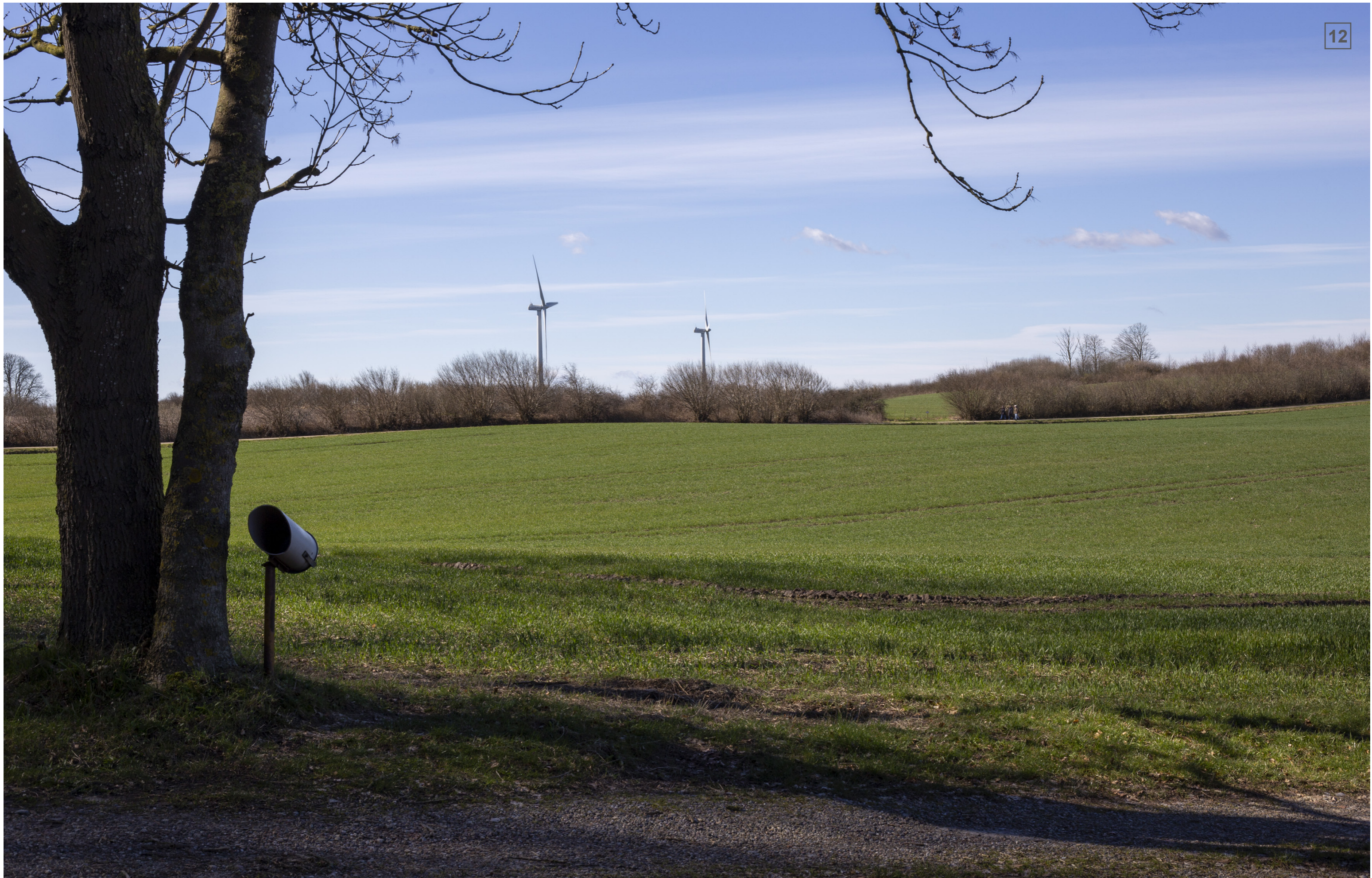
GUDBJERGLUND | FOTOSTANDPUNKT 12 | VISUALISERING MED LEVENDE HEGN (CA. 4-5 M)