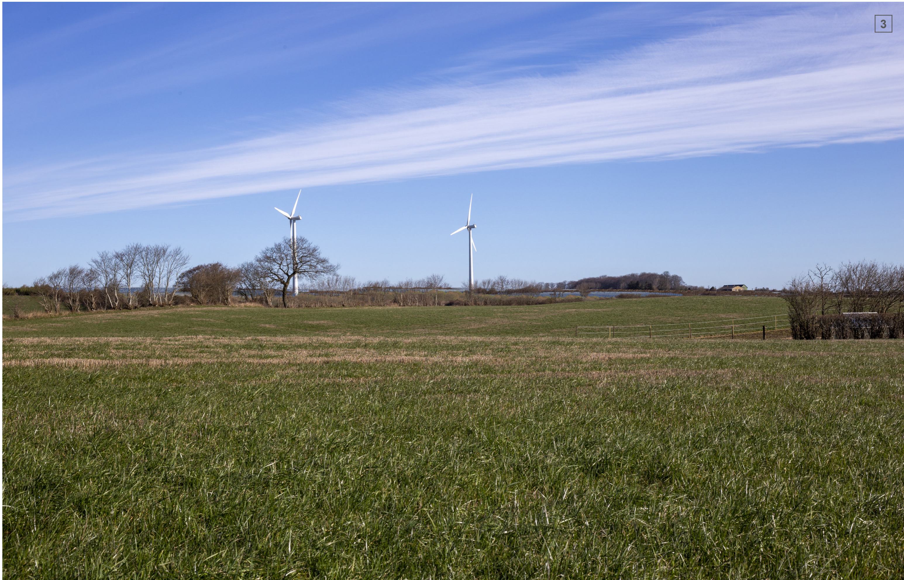
LAKKENDRUPVEJ 51 | FOTOSTANDPUNKT 3 | VISUALISERING MED LEVENDE HEGN (CA. 4 M)