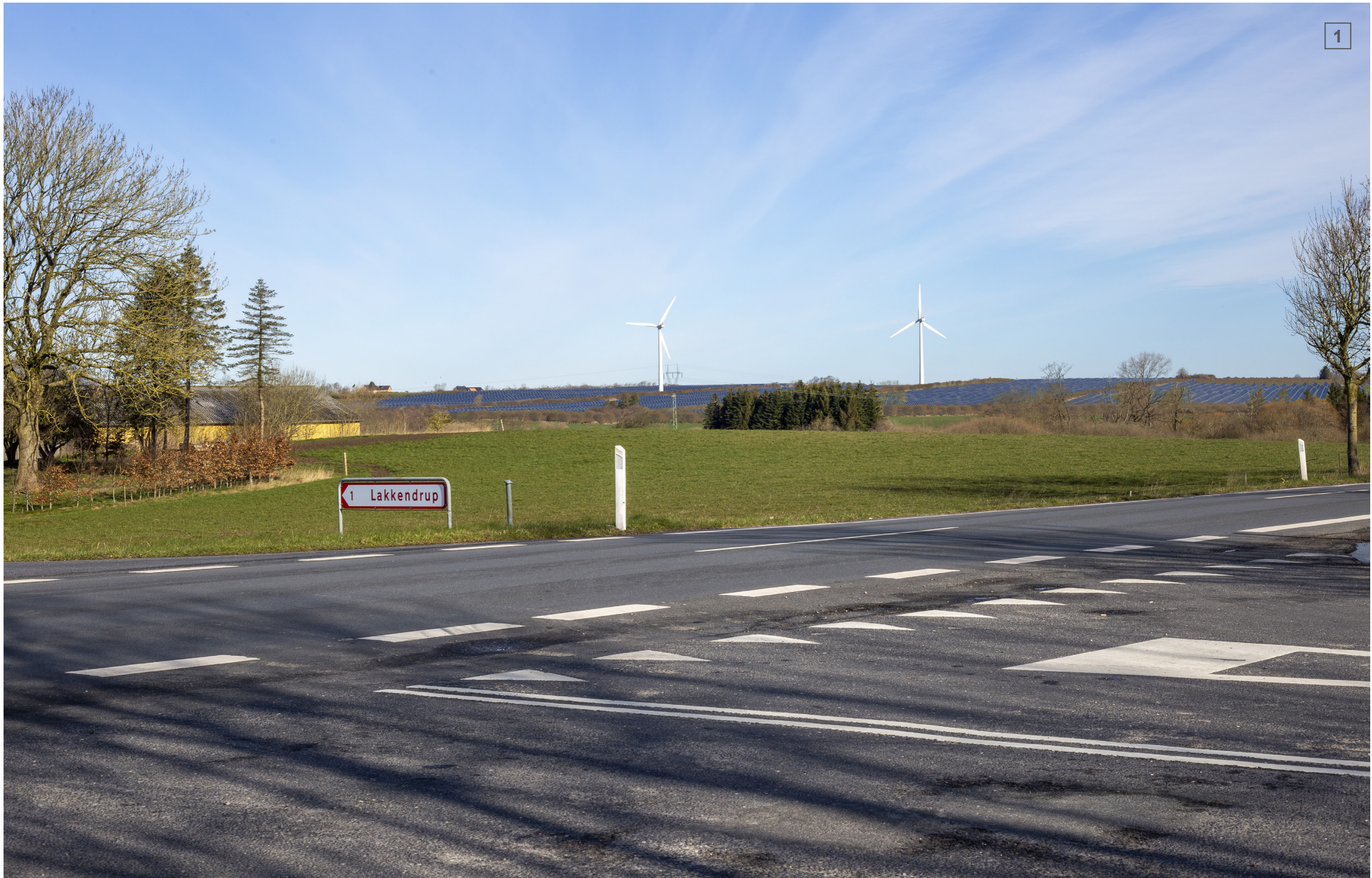
KILENVEJ | FOTOSTANDPUNKT 1 | VISUALISERING MED TRACKER OG LEVENDE HEGN (CA. 4 M)