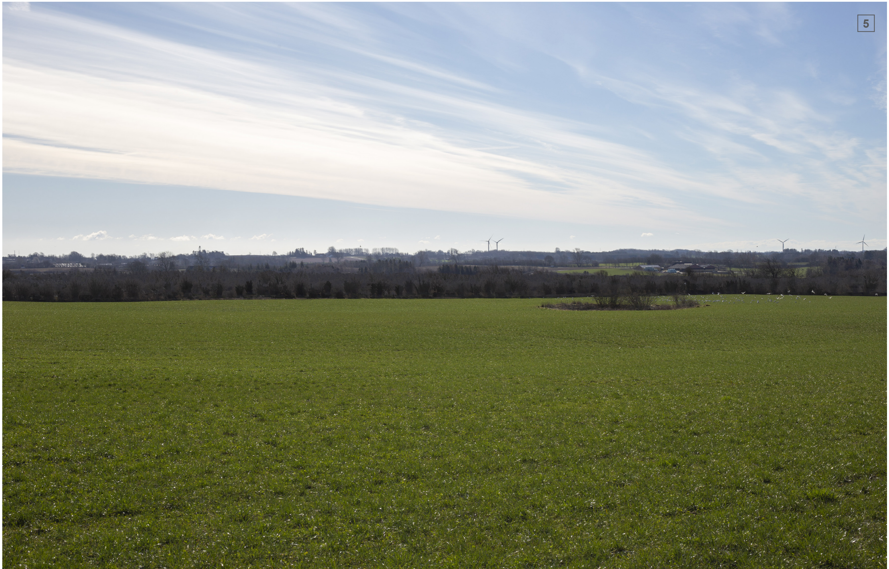
KNØSEVEJ | FOTOSTANDPUNKT 5 | VISUALISERING MED LEVENDE HEGN (CA. 4 M)