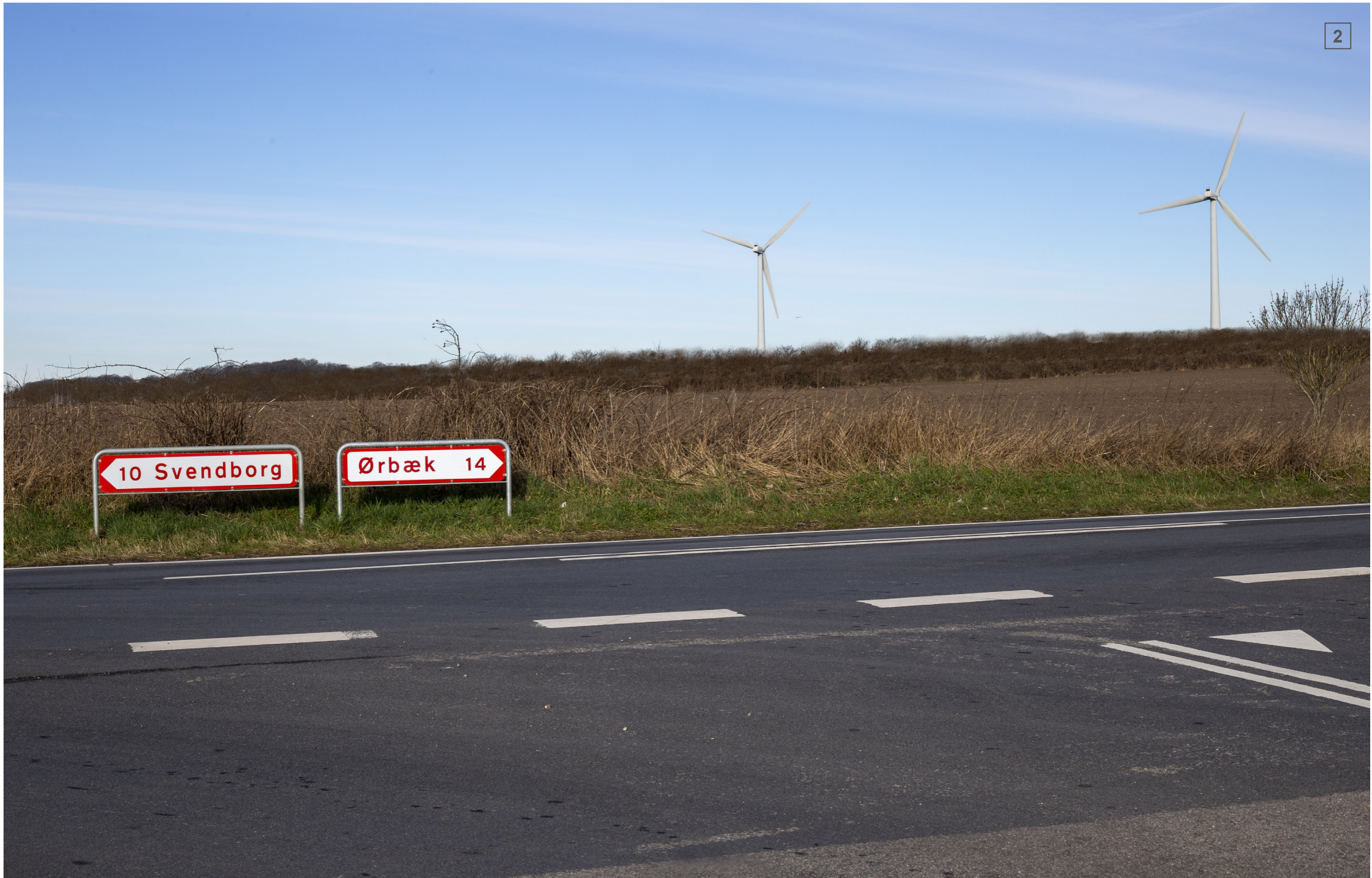
GRYAGERVEJ | FOTOSTANDPUNKT 2 | VISUALISERING MED LEVENDE HEGN (CA. 4 M)