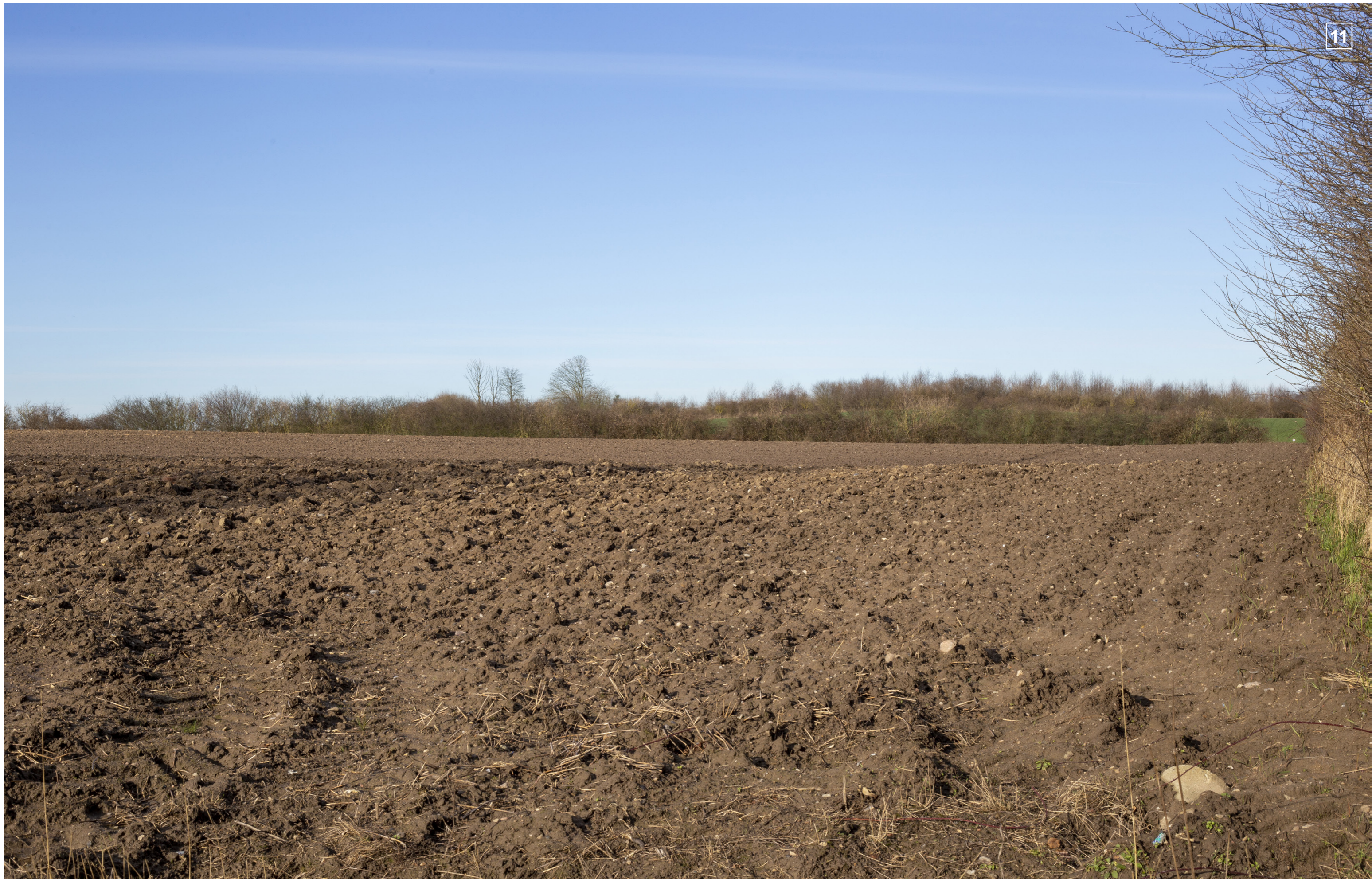
ØRBÆKVEJ 258 | FOTOSTANDPUNKT 11 | EKSISTERENDE FORHOLD