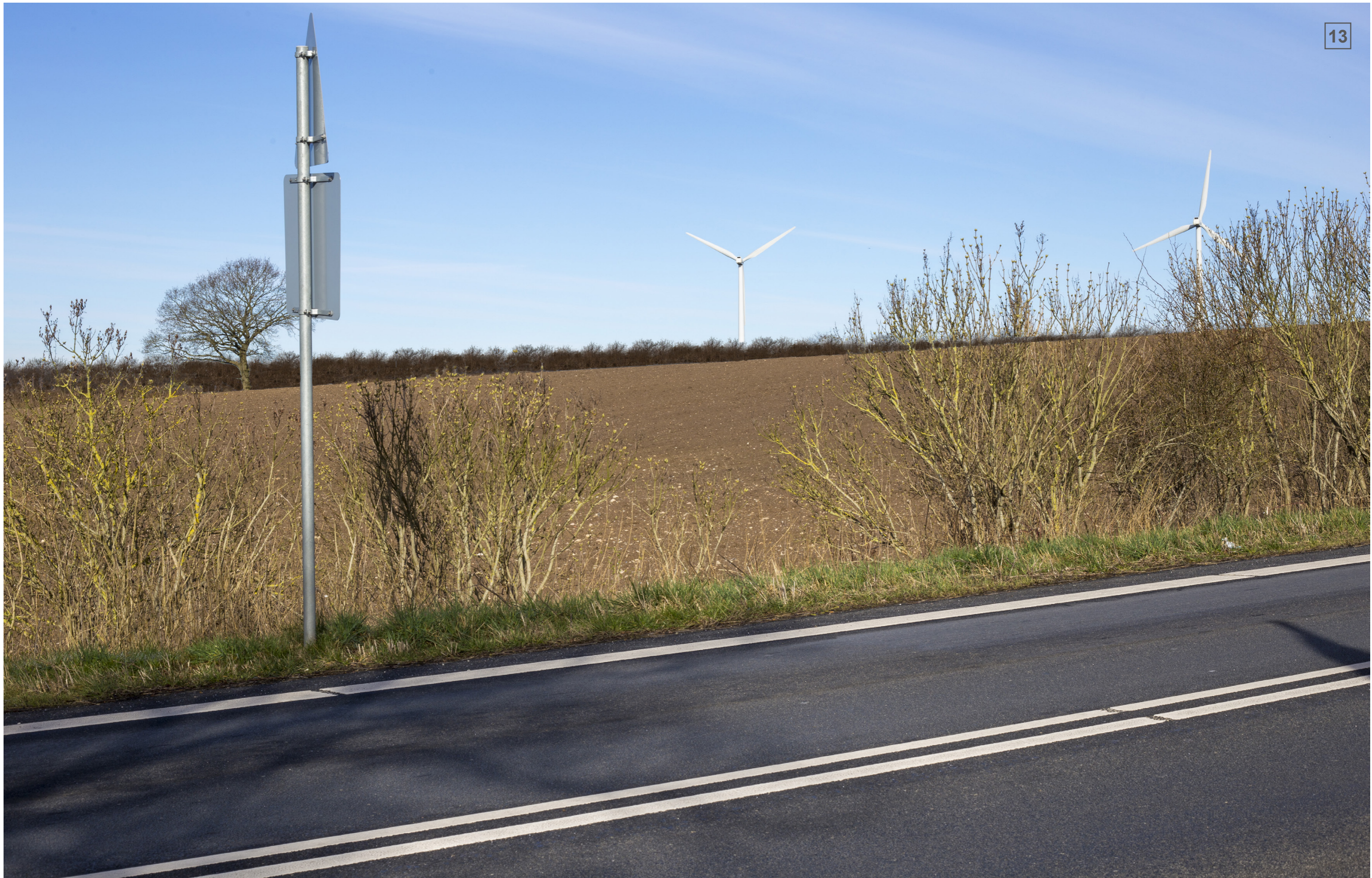
ØRBÆKVEJ | FOTOSTANDPUNKT 13 | VISUALISERING MED LEVENDE HEGN (CA. 4 M)