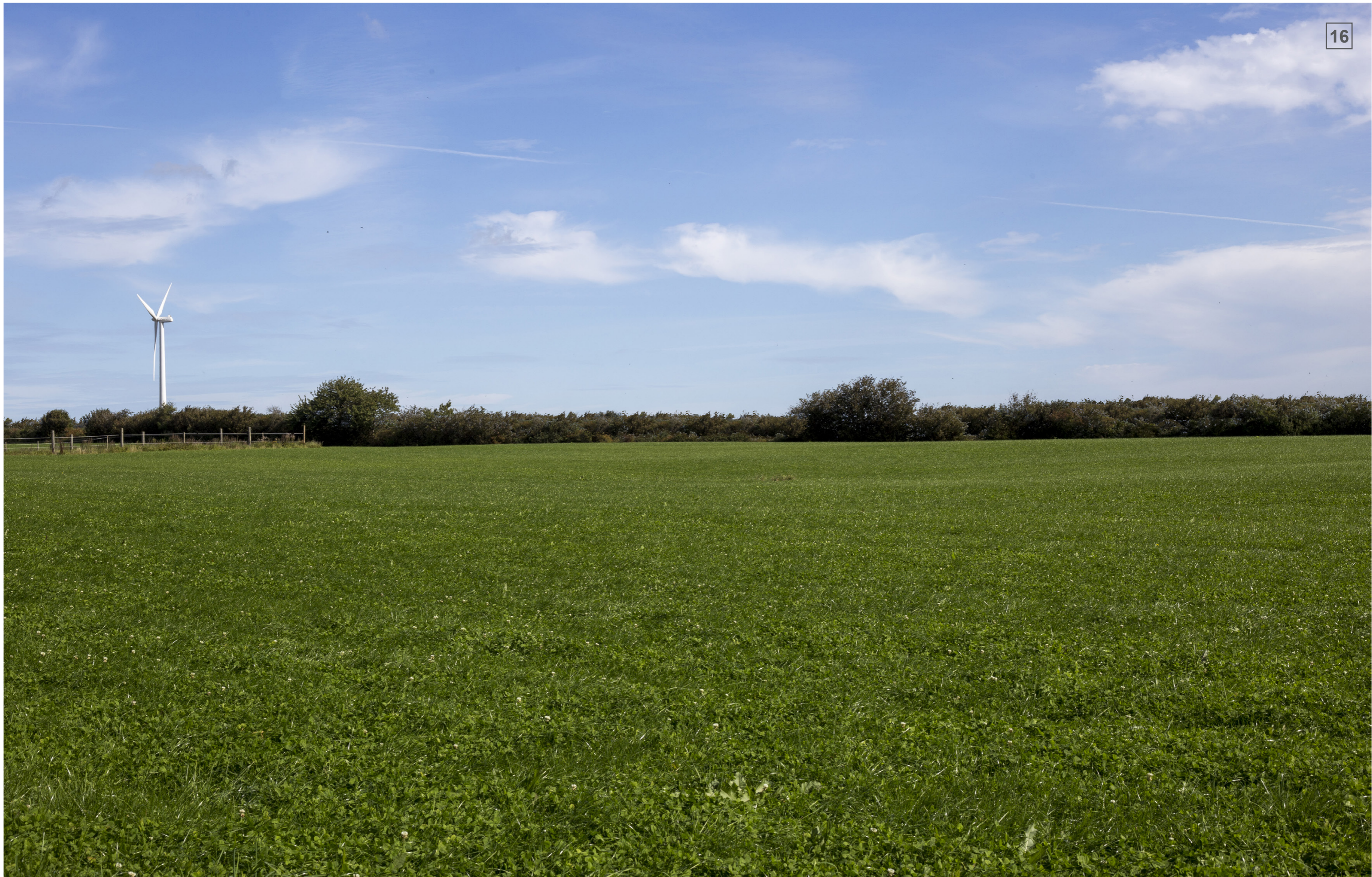
LAKKENDRUPVEJ 46 | FOTOSTANDPUNKT 16 | VISUALISERING MED LEVENDE HEGN (CA. 4 M)